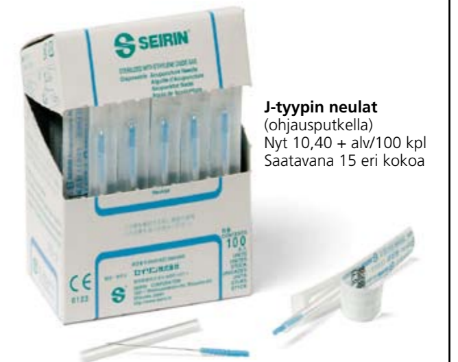
J-tyyppin neulat (ohjausputkella) Nyt 10,40 + alv/100 kpl Saatavana 15 eri kokoa