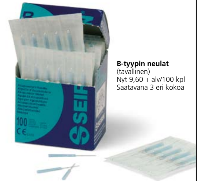
B-tyyppin neulat (tavallinen) Nyt 9,60 + alv/100 kpl Saatavana 3 eri kokoa

Seirin, maailman johtava akupunktioneulojen valmistaja alensi hintoja 43 %, siirrämme tämän edun heti ja täysimääräisenä asiakkaillemme!