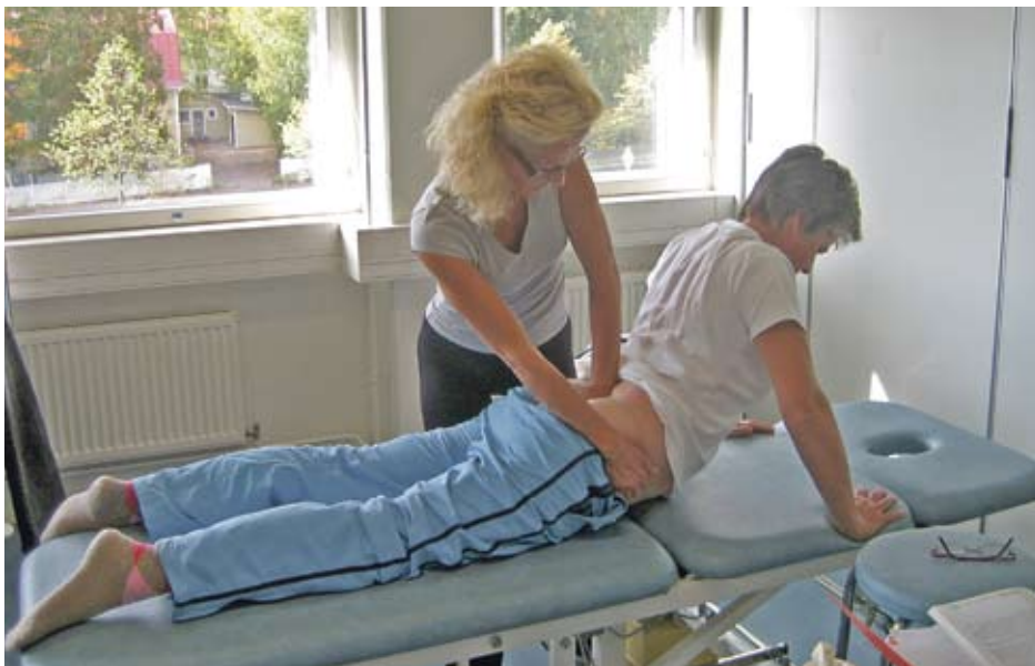
Fysioterapeutit käyttävät työssään monipuolista hoitovälikäyttöä. Osa hoidoista toteutetaan manuaalisesti käsin ja osa erilaisilla hoitolaitteilla.

Helsingin Sanomissa on käyty keskustelua fysioterapiajonoista. Kyse on julkisen terveydenhuollon jonoista. Yksityiseen fysioterapiaan pääsee jonottamatta. Tällä on suuri merkitys saatavuuden kannalta, koska neljä viidesosa eli n. 80 % fysioterapiaa tuotetaan pienissä fysioterapialaitoksissa ympäri Suomea. Stakesin tilaston mukaan yksityisen fysioterapian käyntejä on vuosittain noin 5,7 miljoonaa. Käyttäjäkuntana on koko väestö: lapset, työikäiset, sotaveteraanit, eläkeläiset, eri tavoin vammaiset henkilöt, leikkauksista kuntoutuvat jne.