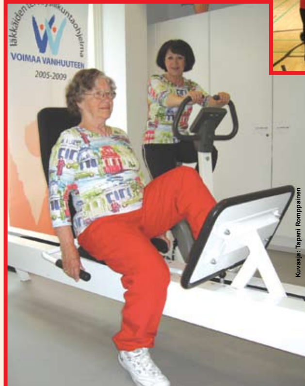
Tanskassa kuntoutus on arvossaan. Suomessakin iäkkäiden liikuntakyvyn turvaaminen on nostettu keskiöön mm. Voimaa Vanhuuteen -terveysliikuntaohjelmassa

sominen ja toiminnallisuus ovat avainasemassa. Kuntouttava ote