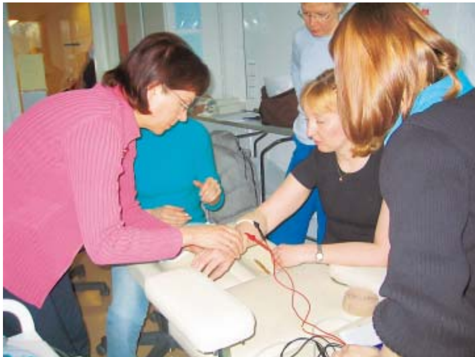
Elektroterapian käyttömahdollisuudet ovat fysioterapiassa moninaiset. Tiedot ajan tasalle – koulutuksen tarkoituksena oli oppia valitsemaan oikea hoitomuoto oikeaan vaivaan, jolloin hoitotulokset ovat muuhun fysioterapiaan yhdistettynä parhaat mahdolliset.

Parhaan hoitovasteen saamiseksi fysioterapeutilla tulisi olla mahdollisimman hyvät tiedot siitä, miten kukin hoito vaikuttaa ja miksi, sekä valmius muuntaa hoitoaan hoitosarjan mitään aina sellaiseksi, mistä asiakas kussakin hoitoprosessin vaiheessa eniten hyötyy.